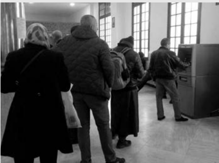
البريد المركزي، ضغط وفوضى

ويبريد حسين داي، وجدنا المشهد نفسه، طوابير، وانقطاعات تزيد من ساعات الانتظار، حيث ذكر لنا أحد الكتاب العموميين، الذي نصب طاولته بمدخل البريد، أن الطوابير تزداد أحيانا، خاصة عند سحب أجور المتقاعدين والأموال الأمنية، حيث تتعقد الأمور وتزداد حدة عندما يقع خلل في شبكة الاتصال، لاسميا في نهاية الأسبوع، عندما لا يضمن المكلفون بتسييرها إصلاحها، أو ملتها بالأوراق النقدية.