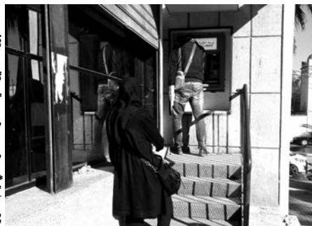
البريد المركزي، ضغط وفوضى