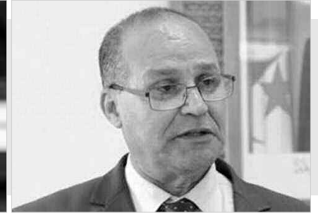
• عبد القادر بوعزغي

والنوادي الرياضية، فيما زار الولاية بعده وزير الأشغال العمومية والنقل عبد الغني زعلان، الذي عابن شبكة الطرق المتعلقة بفك العزلة عن قصور أدرار. وأعطى قرارا بإنجاز طريق رقان - برج باجي مختار على مراحل. أما وزير السياحة والصناعة التقليدية عبد القادر بن مسعود الذي نزل بدوره ضيفا على منطقة برج باجي مختار، فأعطى إشارة انطلاق عيد الجمل بتمياوين الحدودية، قائلا إنه وجب ترسيخه عيدا وطنيا في الطبعة القادمة؛ نظرا لأهميته الاقتصادية والسياحية. كما عابن عدة مشاريع فندقية في طور الإنجاز. وأعطت كل هذه الزيارات التي قادت الوزراء إلى ولاية أدرار، حركة كبيرة لتنشيط ودعم التنمية المحلية، التي تساعد السكان في تحسين معيشتهم اليومية.