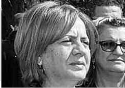
• غنية الدالية