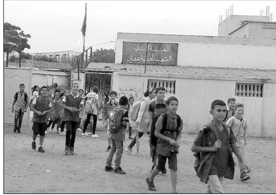
شعبية "المرسى" .. شعبة بلا شعبة

بعض مواطني زموري البحري أو "المرسى"، مثلما تسمى محليا، لما سمعوا بوجود وسيلة إعلامية، سارعوا إلى طرح مشاكلهم اليومية، لاسيما اختراق الطريق وانعدام الإنارة العمومية وغياب الأمن، حيث أكدوا أن "المرسى شعبة بلا شعبة"، أي أنها معروفة لدى الكثيرين بفضل الترويج لها سياحيا خلال كل صافقة، لكن أصبحتنا نستحي عند استقبال السياح بسبب غياب المرافق الضرورية، من إنارة عمومية وطرق مهياة وحتى أمن، بسبب انتشار متاعلي الكحول والمخدرات جوارها نهارا، أمام مرأى الأطفال والتلاميذ، يقول أحد المواطنين، بينما يثير مواطن آخر غياب أوجه التنمية في المرسى بسبب غياب المصانع التي قد تشغل شباب المنطقة، أو حتى غياب موانئ لترفيه الأطفال والعائلات، داعيا والي الولاية إلى زيارة المرسى والوقوف على حالها المزري خلال بقية فصول السنة، كما لفت مواطن آخر إشكالية سعي أحد المستثمرين للاستيلاء على أرضية الملعب الخاص بمدرسة "بلحشية عمران" وما جاوره، رغم امتلاك التجار أصحاب المتاجر القريبة أوراقا رسمية، وقال بأن الملعب رغم أنه صغير وغير مهين، إلا أنه متنفس للتلاميذ، داعيا السلطات الولائية إلى التدخل لحماية الممتلكات وحق التلاميذ في الترفيه.