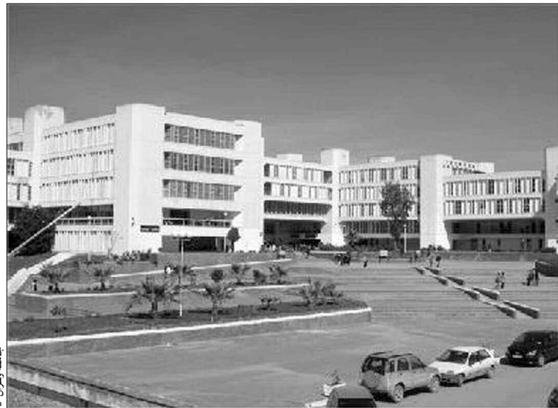
جامعة وهران 2

جاء في إشكالية الملتنقى، أن الكثير من الدول النامية، انتهت وزاد اهتمامها بالمتفوقين من أبنائها، بإجراء بحوث علمية مبنية على أسس علمية ونفسية واجتماعية، وتبادل التجارب فيما بينها، من خلال تطوير وسائل الكشف عنهم في جميع مراحل تدرّسهم، بل وحرصها على عملية الاكتشاف المبكر لهؤلاء ورعايتهم منذ الصغر.