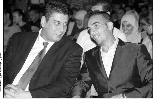
صورة جالب من الحفلة

وتمسك محافظة التظاهرة ببعض الشركاء الفاعلين بهذه الطبعات منذ تأسيسها. كشف مدير الأيام الدولية لسينما سكيكدة، عن تحويل هذه الطبعة من الفترة الصيفية إلى الفترة الربيعية، وعرضها بالجامعة مع النوادي الإعلامية ونوادي السمعي البصري لرفع مستواها أكثر.