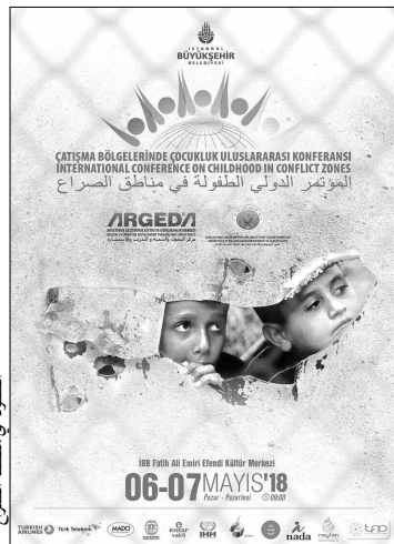
الطفولة في منطقة الصراع