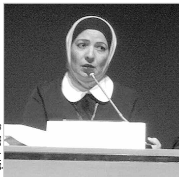
الدكتور آروى الجبري