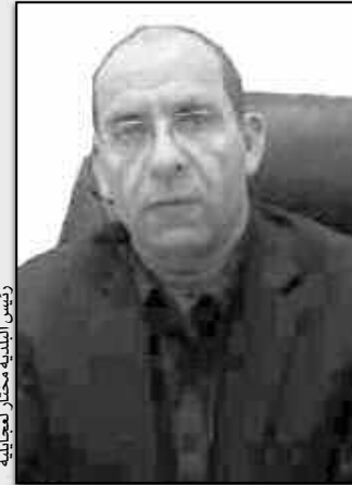
رئيس البلدية مختار لعجاليبة