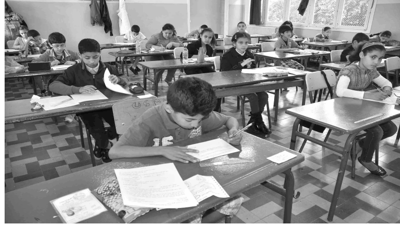
النشاط الاجتماعي والتشغيل.