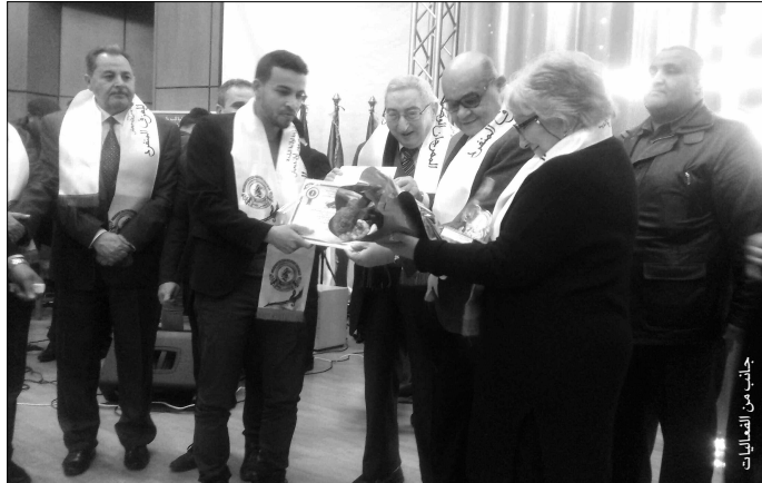
جانب من الفعاليات

بغية إبراز إبداع العازفين الذين يعانون عموما من التعتيم والتجاهل، نظمت جمعية «الوفاء» للنشاط العلمي والثقافي بالبلدية، الطبعة الأولى للمهرجان الوطني للعرز المنفرد في الفترة الممتدة من 22 إلى 24 فيفري الجاري، وعرف حفل اختتامها، منتج الجوائز للفائزين وتكريم قانات الموسيقى والفناء والإعلام.