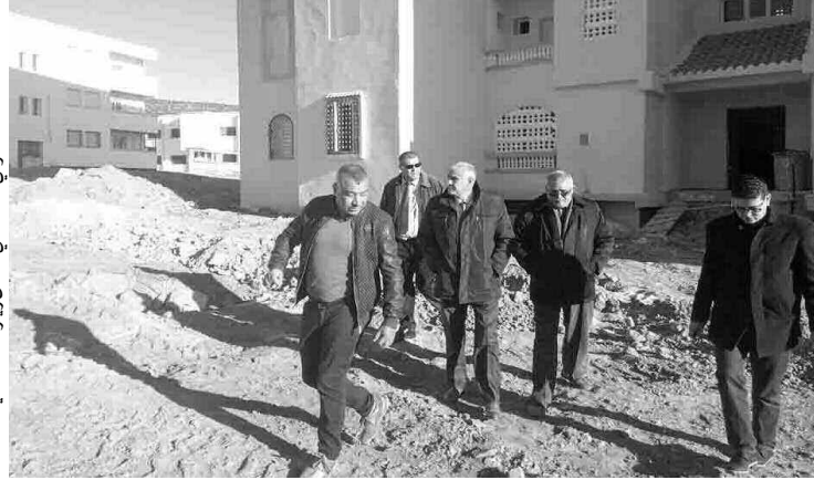
والي خنشلة، في إحدى زياراته التفقدية

تعليمات والي خنشلة، جاءت في ظل الانتشار الكبير للبناءات الفوضوية المنجزة حديثا في مختلف التجمعات السكنية الرئيسية والثانوية وعلى مشارف المدينة، لاسيما بأحياء عين الكرمة، طريق العيزار، طريق بياي، وهو ما دفع المجتمع المدني إلى مطالبة السلطات المحلية بالتدخل العاجل لوضع حد لهذه التجاوزات، بعد استيلاء الخواص من مواطنين ومنتخبين وحتى مؤسسات خاصة على قطع أرضية، دون حصولهم على رخص البناء، وهو ما ترك المجال واسعا أمام الانتهازين للسلطو على الجيوب العقارية المخصصة في الأصل، كمساحات خضراء أو فضاءات لمشاريع عمومية ومرافق ترفيهية وخدماتية، حتى أن هذه البناءات الفوضوية المستعجلة ظلت مهجورة، بغية الاستفادة من برنامج السكن الهش والحصول على سكناات اجتماعية عمومية. كما أن هذه الظاهرة بمدينة خنشلة لم تعد تقتصر على القصدية فقط، بل أصبحت تشيد مساكن بدون أي مقرر للبناء أو حيازة وثائق ملكية. لجان محاربة البناءات الفوضوية ستباشر مهامها بالتنسيق مع مختلف المصالح، لرفع