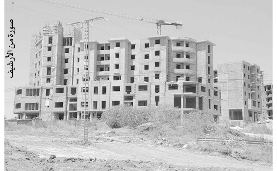
صورة من الأشغال

واستحسن سكان بلديات تيزي وزو لاسيما القاطنون بالمناطق الشرقية، تدخل مصالح الدرك الوطني يوم الخميس، لمنع مجموعة شباب قرية شمال بلدية تيزي وزو، من إغلاق الطريق الوطني رقم 12 في شطره الرابط بين واد عيسى وتيزي وزو، حيث أراد سكان شمال إغلاق الطريق الوطني رقم 12 للمرة الثالثة، للتعبير عن رفضهم قرارا