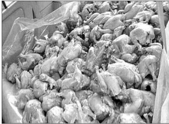
المختصة (المذبح البلدي بسعيدة)، سالف الذكر، فيما تم إنجاز إجراء قضائي ضد