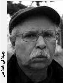
أبدا ص خلال

كشفت الكاتب والروائي المعروف جيلالي خلاص عن قرب صدور عمله الجديد المتمثل في روايته عنوانها «زمن الغريبان»، مشيرا إلى أنها قد تكون في متناول الجمهور العريض في جانيه القادم.