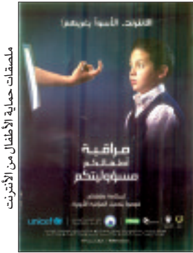
ملصقات حماية الأطفال من الإنترنت

لترفيه والبحث والمعرفة، مليء بالمخاطر والأشخاص السيئين. في حين حملت الصفحة الثانية من المطوية رسائل موجهة للأطفال بأسلوب النداء، جاء فيها: "أيها الأطفال مارسوا حقوقكم في الترفيه، استعملوا عالم الواب بأمان"، خطوات بسيطة تحميكم من المتريصين بكم وهي كالتالي: لا تعلقوا على الخط مباشرة، كن آلي "أون لاين"، لا تقدموا معلوماتكم الشخصية، لا تتناقصوا صوركم وصور عائلتكم مع أشخاص افتراضيين، ولا تسلموا بطاقات ائتمان أولياكم، مع التنبيه أيضا إلى أهمية أن لا يترك الصغار حواسيبهم أو هواتفهم النقالة موصولة بالإنترنت بعد الاستعمال، مع الحرص من التطبيقات المجانية حتى لا يقعوا ضحايا الاحتيال وعدم فتح كاميرا الجهاز أمام أشخاص لا يعرفون هوياتهم، مع الإشارة إلى أهمية تبلغ الوالدين بكل ما يعترضهم، في الوقت المناسب.