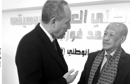
الوزير منى العلاء