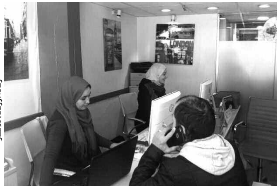
وكالة «روتانا» للاسفار