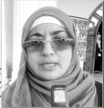
رئيسة المكتبة تبيازة