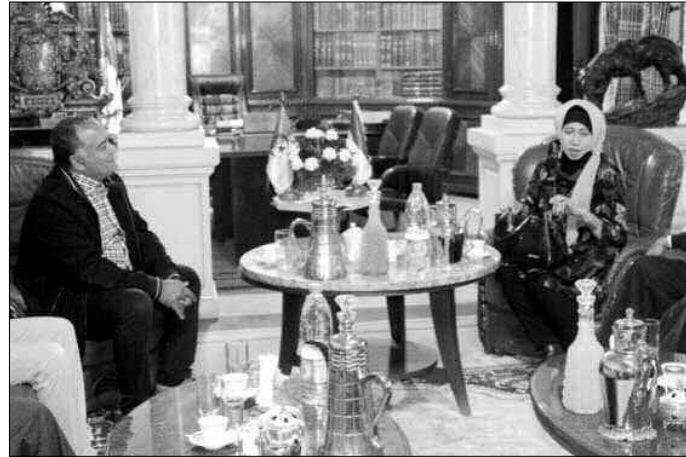
واردات الجزائر نحو أندونيسيا 220 مليون دولار. وقامت السفارة خلال تواجدها بولاية وهران، بزيارة عدة معالم تاريخية ومواقع تخضع حاليا لترميم بأعالي جبل المرجاجو.