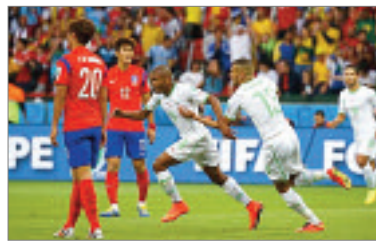
الكاف تأجيل مباريات تصفيات كأس أمم إفريقيا إلى نهاية المونديال. وتلقت الصف اقتراحين من طرف ط.ب

بينما وكوستاريكا، لخوض مباراة ودية معها خلال شهر مارس. ولم يحدد الطاقم الفني والاتحادية إلى حد الآن، المنتخبين اللذين سيواجههما الأخضر في هذا الشهر. وسيكون مدرب المنتخب الوطني راجح ماجر، حاضرا في اللقاء المحلي، الذي سيجمع بين مولودية الجزائر واتحاد العاصمة، على ملعب جويلية هذا الثلاثاء، للوقوف على قدرات لاعبي الفريقين.