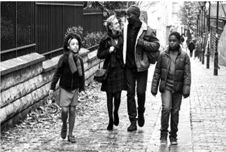
لقطة من الفيلم

تناول الضيفم الروائي الطويل «موسم في فرنسا» للمخرج التشادي محمد صالح هارون، موضوع الهجرة وتدابيراتها على ضحايا النزاعات في إفريقيا الذين فروا بحثاً عن وطن بديل. ويكشف هذا العمل الدرامي مأساة عائلة تتحدث عن إفريقيا الوسطى، حاولت عبثاً أن تجد نفسها استقراً بين الفرنسيين. وأعطى المخرج مقارعة شائعة عبر مستويين، الأولى مرتبطة بفكرة ایجاد بلا دعوى بلادهم استضافت، والثاني يهزم بأنه لا يوجد مكان في العالم يمكن أن يؤويه.