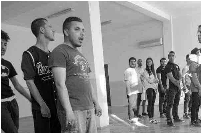
جانب من الدورة التكوينية