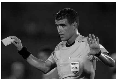
في المونديال الأخير لأقل من 17 سنة الذي جرى بالهند، وعين حكما رابعا في المباراة النهائية بين إنجلترا وإسبانيا،