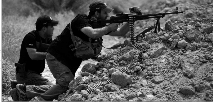
صورة من جبهة النصرة