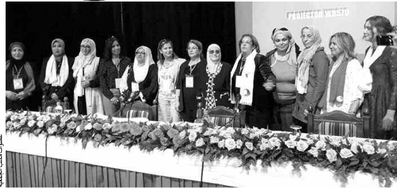
عضوات مكتب الجمعية