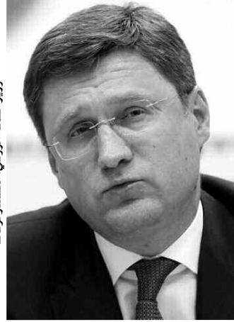
وزير الطاقة الروسي، ألكسندر نوفاك

المتعاملين الجزائريين إلى عدم الاكتفاء بالبحث عن الفرص في العاصمة، وإنما الاتجاه نحو المناطق الروسية الأخرى التي تتوفر على فرص هامة. من جهته، أكد نائب رئيس مجلس الأعمال الجزائري-الروسي وممثل مجموعة «غلوبال ريسورسز أند أندوستريز» التي تتكون من حوالي أربعين شركة روسية فلابد من استثمار في روسيا على رغبة الجانب الروسي في تقديم الخبرات والتقنيات وتحويل التكنولوجيا إلى الجانب الجزائري، مشيراً إلى أن قوانين الاستثمار في الجزائر لا تشكل أي عائق بتوفر عامل «الثقة» بين الطرفين. كما توجت الزيارة التي قام بها الوزير الأول السابق عبد المالك سلال لموسكو بالتوقيع على جملة من الاتفاقيات شملت قطاعات الصناعة والمناجم والبحث والجيولوجيا والطاقة النووية ذات الوجهة السلمية.