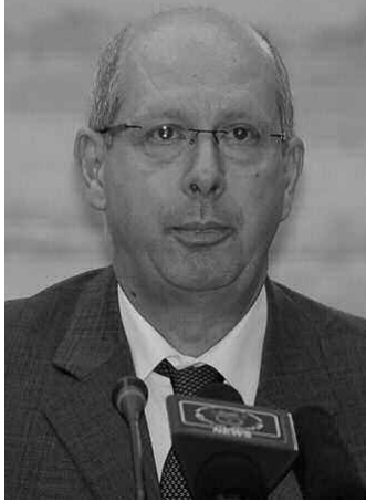
وزير الطاقة الروسي، ألكسندر نوفاك