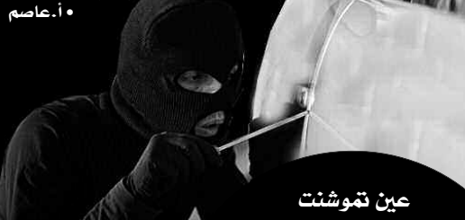
عين تموشنت احتراق 12 عدادا كهربائيا

عقب تقدم أحد المواطنين بشكوى على مستوى الأمن الحضري لبني مراد بالبلدية، بخصوص تعرض سيارته من نوع (رونو 4) للسرقة على الفور تم تكليف عناصر الشرطة بتكثيف الأبحاث والتحريات على مستوى قطاع الاختصاص والتي أفضت إلى العثور على السيارة مركونة على مستوى أحد الحقول بمنطقة بني مراد وبداخلها مفاتيح، قطعيتين من السلك بالإضافة إلى منشار يستعمل في قطع الحديد، ليتم بعدها إجراء عملية ترصد بعين المكان وبعد مدة زمنية قصيرة اقترب أحد الأشخاص من السيارة المسروقة ليتم القبض عليه وتحويله إلى المصلحة، حيث اعترف هذا الأخير بعملية السرقة رفقة شخص آخر والذي تم توقيفه بدوره واقتياده إلى المصلحة وبعد مواجهته بالتهمة المنسوبة إليه صرح أنه لا علاقة له بالعملية، مدعيا أنه لا يعرف المشتبه فيه الأول. وعليه تم إعداد ملف قضائي ضد المشتبه فيهما وتقديمهما أمام السيد وكيل الجمهورية لدى محكمة البلدية، حيث صدر في حقهما أمر إيداع.