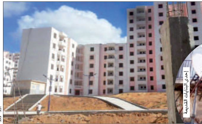
إحدى البنايات القديمة

الإنجاز. زيادة على ذلك، هنا سؤال جوهري آخر يمكن طرحه وهو: "ما الذي يمنع الجهات المسؤولة من توزيع أكثر من 6 آلاف وحدة سكنية منتهية. حسب التقرير، على مستحقيها حسب أجنحة مضبوطة وحسب الأولويات". وعلى ضوء المعلومات التي جمعتها "المساء" من هنا وهناك ومن خلال زيارتها لبعض ورشات قطاع السكن بعاصمة الولاية سواء على مستوى مجمع بوعباز أو الزفازف أو مسييون، اكتشفنا أن هذه المواقع مازالت ورشات، وهناك سكنات، كما هي الحال بعدد من عمارات الزفازف، تعتمد بها التهئة الخارجية رغم أن أشغالها انتهت منذ أكثر من سنتين، يبقى السؤال الآخر الذي يفرض نفسه: "أين القامعون على قطاع السكن الذي أولته الحكومة الأولوية الكبرى".