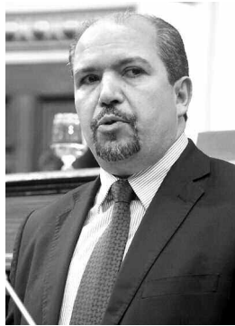
هوامش دورة تكوينية لفائدة الأئمة، نظمت يوم الخميس بدار الإمام

كما دعا وزير الشؤون الدينية والأوقاف عيسى من جهة أخرى الأئمة إلى العمل على حث المواطنين وتحسيسهم بضرورة المشاركة بقوة في الانتخابات التشريعية المقبلة والمزمع تنظيمها في الرابع ماي المقبل وذلك دون تفضيل أو انحياز لحزب أو مرشح معين، مؤكدا على ضرورة أن يعمل كل إمام على توعية المواطنين بمدى أهمية هذا الموعد الانتخابي بالنسبة للبلاد، محذرا في ذات الوقت من استغلال منابر المساجد لصالح مرشح أو أي تنظيم سياسي على حساب آخر، مذكرا بأن القانون يمنع ذلك، واعتبر عيسى أن الهدف من مشاركة الإمام في التحسيس هو اختيار الرجال المناسبين والصالحين الذين يمثلون المواطنين أحسن تمثيل.