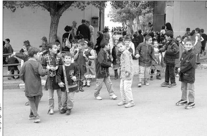
صورة من الأرشيف

كشف رئيس المصلحة التقنية ببلدية الروبية، عن برمجة إنجاز ست مدارس ابتدائية، سيتم تدشين ثلاث منها مع الدخول المدرسي المقبل، في حين لا تزال الأشغال جارية لتسليم المشاريع في الأجل المحدد، حيث ستتوفر بعض المدارس الابتدائية المزمع تدشينها بين 18 قسما تربويا في المؤسسة الواحدة، إلى غاية 12 قسما ببعض المؤسسات التربوية الأخرى، فيما ستتوفر بعض المدارس الابتدائية على 6 أقسام، حسب درجة الكثافة السكانية بالمنطقة.