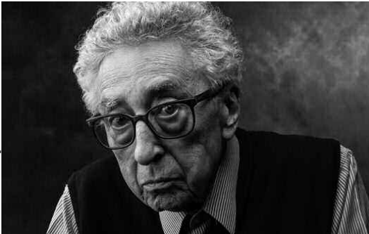
الراحل شاول هنري فافرو

تحتضن المكتبة الوطنية يومي 18 و19 مارس الجاري، «أيام سويسرا الجزائر»، وذلك بالتعاون بين الوكالة الوطنية للإشعاع الثقافي والسفارة السويسرية وجمعية «ديفارسييتي». وتهدف الفعالية إلى تنشيط الذاكرة المشتركة بين البلدين، واستحضار مآثر المناضلين السويسريين الذين وقفوا إلى جانب الشعب الجزائري، في أيامه الصعبة إبان الثورة التحريرية، مع إضافة بعض أبناء سويسرا، الذين سجلوا جواباً من هذا التاريخ المجيد.