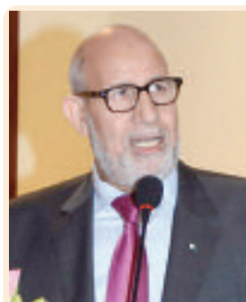
الهيئة المستقلة للانتخابات هذه الليلة جلسة عمل مغلقة مع أعضاء المداومة لولاية غرداية التي يبلغ تعداد الهيئة الناجبة بها 212.971 ناخبا وناخبة. و.

ودعا رئيس ذات الهيئة التي تتحمل مهمة السهر على احترام القانون والأداء الجيد لاختيار الديمقراطية كافة الفاعلين (أحزاب سياسية ومرتشحين وإدارة)