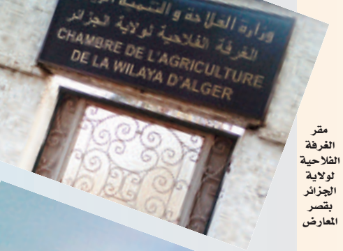
مقر الفرقة الفلاحية لولاية الجزائر يقصر المعارض