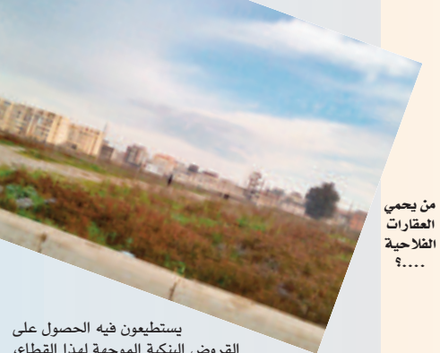
من يحمي العقارات الفلاحية ؟.....

يستطيعون فيه الحصول على القروض البنكية الموجهة لهذا القطاع، ومنها قرض «الرفيق» وقرض «التحدي» الذي لا تستطيع أغلب المزارع الاستفادة منه، بسبب القوانين التي ترهن منح هذه المساعدات، ومنها مشاكل أراضي الشيوخ والخلافات بين الفلاحين، وكذا الحصيلة الجائبة التي لا يوفرها الفلاح، وهي الشروط التي يفرضها القانون المنظم لعملية منح القروض.