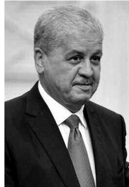
الوحيدة التي تستحق أن نخوضها وهي معركة السلم والاستقرار.

واختتم السيد سلال «من واجينا جميعا، بلدان حوار وبلدان إفريقية وبلدان شريكة ومجتمع دولي ومنظمات إفريقية وإفريقية مرافقتهم من خلال أجندة موحدة تتمثل في الاستتباب المستديم للسلم والاستقرار والأمن».