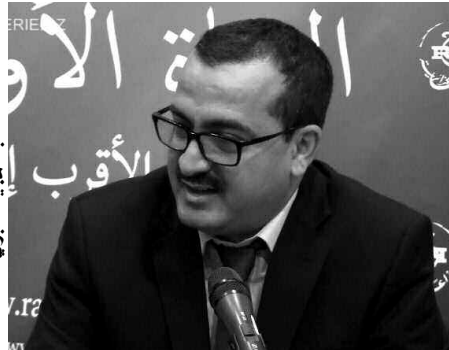
خبزي، أن اليوم الإعلامي يهدف أيضا إلى توضيح الرؤية بالنسبة للمالية لسنة 2017