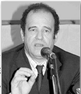
عبد القادر بن دعباش

يجري حالياً الإعداد لمرسوم تنفيذي حول علاقة العمل بين الفنانين وأرباب العمل لتدارك الفراغ القانوني في هذا المجال، حسبما أكد مؤخراً بالجزائر العاصمة رئيس المجلس الوطني الاستشاري للفنون والآداب عبد القادر بن دعباش. وأوضح المسؤول في تدخل له خلال حصة للإذاعة الثقافية، أن النص الجاري إعداده والذي من المرتقب إصداره خلال 2017، يشكل قاعدة قانونية فيما يخص علاقة عمل الفنانين التي لم تحدد ليومنا