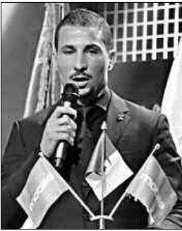
تحسبا للاستحقاقات المقبلة