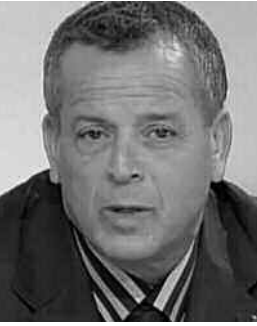
العارضة الفنية للخضر.

ورفض اللاعب السابق للمنتخب الوطني من جهة أخرى تحميل رئيس الاتحادية محمد روراوة المسؤولية الكاملة، فيما حدث للفريق الوطني في دورة كأس أمم إفريقيا بالغابون، حيث قال في هذا الشأن: «محمد روراوة لا يمكنه أن يدخل إلى أرضية الميدان ويسجل الأهداف، تلك مهمة اللاعبين الذين فشلوا في كل ما قاموا به، لاسيما في المبارتين الأولى أمام زيمبابوي وتونس، حيث كان بوسعنا التغلب على هذين المنتخبين لو قدم لاعبونا مردودا في مستوى سمعته، أظن أن الأمور كانت ستسير بشكل جيد لو تحمل كل لاعب مسؤوليته داخل أرضية الميدان».