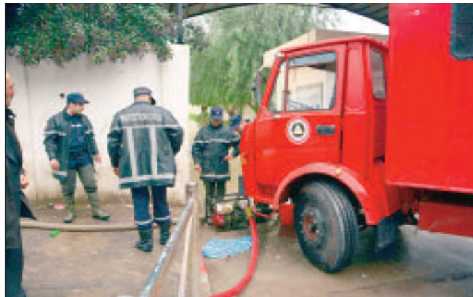
22 ألف قارورة.

وأشار محدثا إلى أنه إلى حد الآن لا تزال العديد من الطرق مغلقة، منها الطريق الوطني رقم 15 على مستوى فج تيروردة، الطريق الولائي رقم 253 على مستوى فج شلالة بضواحي بلدية إفرحونان، وكذا الطريق الولائي رقم 09 على مستوى فج شلالة بضواحي بلدية إيلولة أوامو، والطريق الولائي رقم 251 على مستوى فج شريعة بوزقان، والطريق الوطني رقم 30 على مستوى فج تيزي نكويلا ببلدية بوردان، حيث تواصل عملية فتح الطرق، لاسيما أن سلك الثلوج بلغ أكثر من مترين.