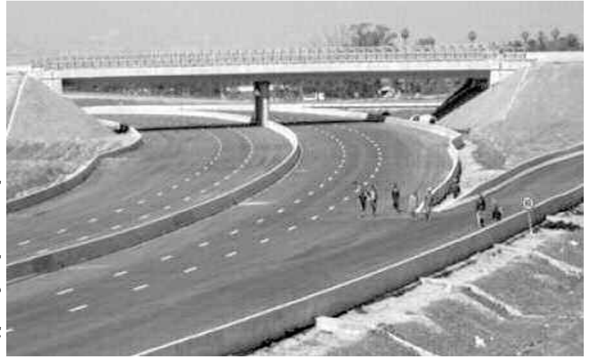
صيانة المنشآت الفنية ضمان لسلامة المواصلات