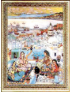
لوحة محمد رسيح