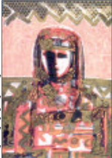
لوحة الراحل لزهير حكار

أشار إعلان وزير الثقافة عز الدين ميهوبي عن لإنشاء سوق للفن التشكيلي خلال تكريم الفنان الراحل أحمد إسيباخم بـ 50 سنة مضت، العديد من ردود الفنانين التشكيليين وأصحاب الأروقة الفنية وكل مهتم بهذا الفن الجميل، بين متسائل عن إمكانية تجسيده على أرض الواقع، وآخر مقدم لشروط تحقيقه، في مقدمتها فتح عدد أكبر من الأروقة. اقتناء المتاحف ورجال الأعمال ومؤسسات الدولة لأعمال الفنانين، تنظيم معارض دولية وبيناي، فتح ورشات فنية وحتى إبطال