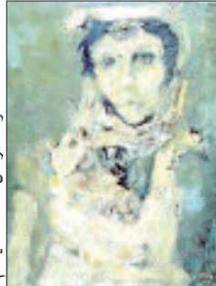
لوحة الراحل أحمد إسيباخم