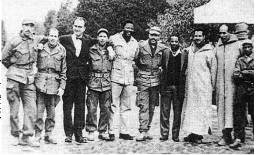
مانديلا أثناء عملية التدريب بالجنرال (1962)

سباسة الميز العنصري، فكان ذلك سببا في إصدار أول حكم ضده بالسجن مع عدم التفتيد. وتوالى بعد ذلك سلسلة الاعتقالات السياسية التي لا حقت "ماديبا"، بتهمة انتهاك قرار حظر الشيوعية، وألقي عليه القبض في 1956 بعد رفضه تحديد إقامته، ووجهت له تهمة الخيانة العظمى والتآمر لإسقاط الدولة قبل أن تسقط التهم المنسوبة إليه.