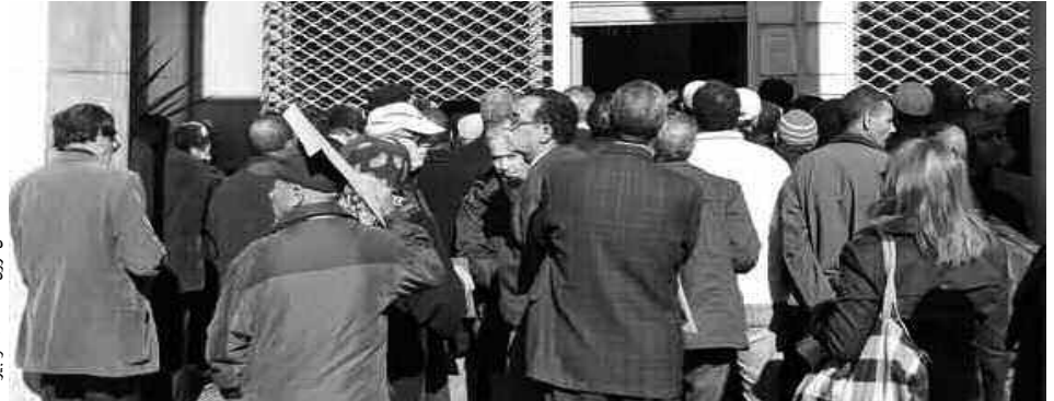
هل ترون مشاهد الطوابير؟؟؟

بينما طرح البعض إشكالية تخصيص يوم الاثنين للاستقبال، ويرونا بأنه غير مناسب على الإطلاق على أساس أن جل العمال يشتغلون وأن العديد منهم يجدون صعوبات في مغادرة مواقع عملهم من أجل مقابلة أي مسؤول من المسؤولين، نفس الشيء أيداه بعض العاملين في قطاع التربية، حيث طلب منهم عند رغبتهم في مقابلة مسؤول القطاع، احترام السلم الإداري، وهو أمر اعتبره العديد ممن تحدثنا إليهم مخالفا للتعليمات، لأنه بالاعتماد على هذه الطريقة فلن يتأتى لهم مقابلة المسؤول، خاصة إذا كان المشكل المطروح لا يتطلب التأخير، إضافة إلى أن الأمر لا يخدم العاملين في القطاع، الذين يقطنون في مناطق داخلية بعيدا عن مقر عاصمة الولاية.