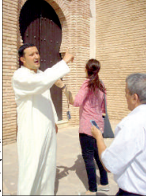
مدخل جنوبي باب القصبية