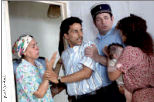
لقطة من الفيلم

في المقابل، عمد المخرج على ميزانين في المشهد المخصص لعمر وتلك المتعلقة بتجري الكاتب بيار إيمانويل فوغرون الذي اقتبس دوره من حياة الكاتب جون ماري روار يعمل عند جارتها بالسكالك. يدخل عمر في الإضراب عن الطعام، مما يؤدي به إلى المستشفى، حينما يزوره والده في السجن بكيان معا، ورغم عدم وجود فقرة دم الضحية في لباس المتهم، إلى جانب عدم إيجاد سلاح الجريمة، إلا أن الاتهامات انصبت في وجهه واحدة... عمر، أبعد من ذلك، تلقت الضحية عدة طعنات، لكنها لم تكن مميتة وتم إيجاد كتابة "عمر قتلتني" مكتوبة بدم الضحية مرتين: الأولى تحمل خطأ نوحيا والثانية غير مكتملة، وأكد دفاع المتهم أن الضحية لا تسحب جسدها لكتابة المقولة، كما أنها لا ترتكب أخطاء نوحية بل تم سحبها، بالتالي