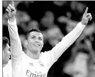
بنفيكا البرتغالي - بوروسيا دورتموند الألماني.