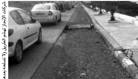
المهابلات من جديد، لكن فقط في الأماكن المناسبة لها.

الأحياء التي مستها أشغال الصيانة مؤخرًا، على غرار طرق حي ناصر بوعالم بالواجهة البحرية وحي 11 ديسمبر، أما بالنسبة للطريق الوطني رقم 11 فيوضع السيد عزو، أن مشاريع تهيئة الطرق الرئيسية هي من صلاحية مصالح الأشغال العمومية.