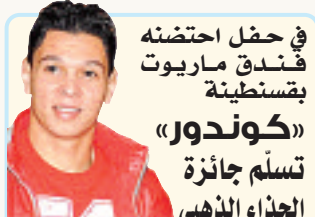
«كوندور» للالكترونيك والأجهزة

أشرف نهار أمس والي قسنطينة، السيد كمال عباس، على توديع رؤساء الدوائر الستة الذين شملتهم حركة التحويل الأخيرة التي أجراها رئيس الجمهورية السيد عبد العزيز بوتفليقة. تم منح إطارات الولاية الذين غادروا قسنطينة لاستلام مهام أخرى أو الذين تم إحالتهم على التقاعد، هدايا رمزية، حيث أكد الوالي أن هذه المبادرة تدخل في إطار تقديم الدعم المعنوي لهذه الإطارات التي خدمت الولاية وتفاعلت في تقديم مجهودها من أجل خدمة المواطن، متمنيا التوفيق للإطارات التي تم تحويلها إلى ولايات أخرى وفي مهام جديدة لخدمة الصالح العام في إطار تطبيق سياسة الحكومة في