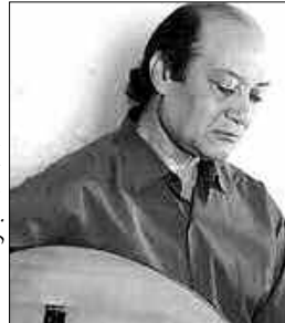
الروائيين الجزائريين خصوصا الشباب.

وحسب الصحف المصرية، سيتم خلال فعاليات المعرض تكريم الكاتب المصري محمد سلماوي على كامل منجزه الثقافي والأدبي، وسيقوم وزير الثقافة عز الدين ميهوبي بمنح الكاتب «درع الكمال»، الذي يمنح لكبار المدبرين والمثقفين. البرنامج يبدأ يوم الخميس بعرض مرثي «ذاكرة المعرض».. أمسية شعرية لمحمود درويش 2004، يعقبها ندوة بعنوان «العلاقات الثقافية المصرية الجزائرية»، يتحدث خلالها الكاتب حلمي النمنم وزير الثقافة، والكاتب عز الدين ميهوبي وزير الثقافة الجزائري، وتقديم الكاتب محمد سلماوي، وذلك بقاعة «الجزائر» إلى جانب ندوة «الثقافة المصرية في المواجهة»، يتحدث خلالها المفكر نبيل عبد الفتاح، تقديم الدكتور هيثم الحاج على رئيس هيئة الكتاب، كما يقدم المنشد على الهلباوي حفل إنشاد ديني إضافة إلى عزف العود والقانون بقاعة «علي معاشي» بالمعرض، إضافة إلى عرض سينمائي «فيلم قصر الشوق».