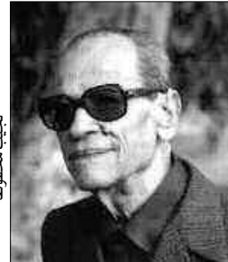
الروائيين الجزائريين خصوصا الشباب.

و«القاهرة 30» و«الناصر صلاح الدين» و«فتاة المصنع»، فضلا عن ندوات فكرية وثقافية يشارك فيها الأدباء والنقاد أحمد أبو خنيجر، طارق إمام، عزة سلطان، حسن زكي، سلمى أنور، الدكتور شوكت المصري، والسيناريست عبد الرحيم كمال، إضافة إلى عروض تسجيلية من ذاكرة معرض القاهرة الدولي للكتاب، وهي عبارة عن لقاءات جرت في أزمنة مختلفة بمعرض القاهرة مع كبار المثقفين والمفكرين المصريين، وهم المخرج يوسف شاهين والكاتب الصحفي محمد حسنين هيكل والمفكر الدكتور عبد الوهاب المسيري والعالم المصري الحاقز على جائزة نوبل الدكتور أحمد زويل. والسلافة أن دور النشر المصرية اعتادت على المشاركة بقوة كل سنة في الصالون الدولي للجزائر، على رأسهم دار الشروق المصرية والدار المصرية اللبنانية، ودار العين التي تقود في السنوات الأخيرة بمبادرات مهمة في مجال الطباعة المشتركة بين مصر والجزائر من خلال استقطابها