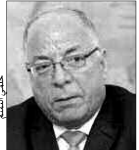
الروائيين الجزائريين خصوصا الشباب.

ونقلت الصحف عن وزير الثقافة المصري قوله بأن مشاركة وزارة الثقافة المصرية في صالون الجزائر للكتاب، تأتي في إطار حرصها على دعم وتطوير العلاقات المتميزة مع دولة الجزائر الشقيقة، فضلا عن المشاركة في كافة الفعاليات والمعارض المتخصصة في مجال الكتاب والثقافة، فيما أوضح الدكتور هيثم الحاج رئيس هيئة الكتاب، أن الهيئة ستقوم خلال أيام هذا المعرض بإطلاق سلسلة من الندوات والأمسيات الفنية والغنائية. ويضم البرنامج الذي يستمر حتى 5 نوفمبر الداخل، مجموعة متنوعة من الندوات واللقاءات والعروض السينمائية، حيث يلتقي الجمهور بالفنان أحمد الحجار والشعراء علي منصور وناصر دويدار وسالم الشهباني، ويتفاعل كذلك مع رؤية جديدة لتاريخ مصر الفرعوني، يقدمها الدكتور مدود الدماطي وزير الآثار السابق، و«مصر وثورة التحرير» للدكتور أحمد الشربيني، بالإضافة إلى مشاهدة نخبة متميزة من أبرز أفلام السينما المصرية، وهي «المومياء» و«البوسطجي» و«بين القصرين» و«ناصر 56» والاختيار