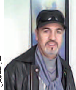
الفنان خالد بوكراع