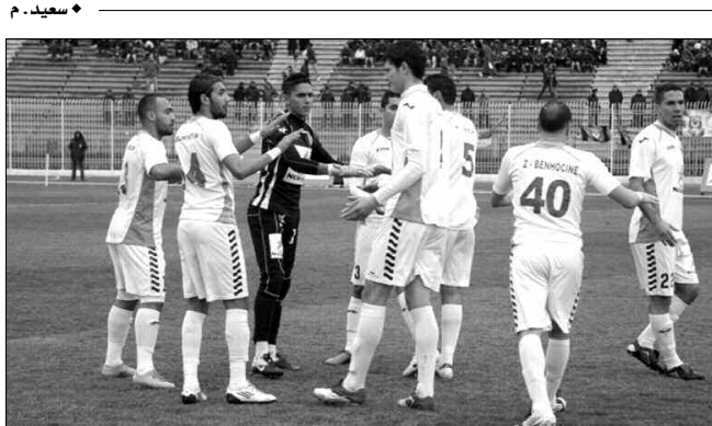
الذهاب بعيدا في هذه المنافسة بعدما أجبر على مغادرتها في الدور الهجوي الغربي الأخير منها في السنتين الماضيتين.

تشكل مواجهة فريق أمل مروانة أهمية بالغة لدى المستضيف فريق جمعية وهران، من منطلق أن الفوز بتقاطها سيمنح الوهرانيين من البقاء في مركز الوصافة على الأقل، هذا إن لم يفتقدوا إلى الصدارة سواء بفرضهم أو بالشراكة مع الرائد اتحاد سيدي بلعباس في حال اعتزته أمام الجارة مولودية سعيدة. وفي كل الأحوال، فإن "الجماعة" هم في "القاعدة" قبل إسداد الستار عن شق الأول من البطولة الاحتراافية الثانية بثلاث جولات، قد تهديهم تقيا شتوا هو أكثر من مستحق لديهم.