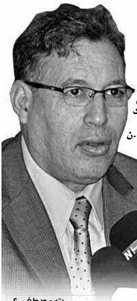
ت: مصطفى ع.

الأجنبية في هذا التفتيت المنهجي، من خلال سياسة "فرق تسد" ليقضي طرف على طرف ثم يتدخل الأجنبي كضابط، ثم يتصل من عودته لأي طرف داخلي وعده، ويبسط سلطته الاستعمارية من جديد، وهو الأمر الذي يشهده الواقع العربي اليوم. ويؤكد المحاضر أنّ لعبة القوى الأجنبية تهدف إلى هدم كل الأطراف وتأجيج كل مظاهر الاختلاف، كي تطفئ على العوامل المشتركة وبالتالي زرع الفتنة. وقد أثنى على سياسة الجزائر المتمثلة في التعامل مع الدول وليس المجموعات مما حماها من أن تكون ضحية للتدخل وزرع الفوضى على ترابها الوطني رغم شجاعتها.