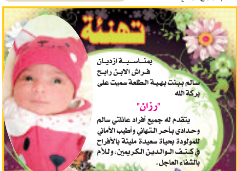
بمناسبة ازيان فراس الإين رابع سالم بينت بهية الطلعة سميت على بركة الله