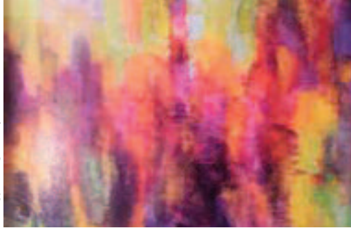
إحدى اللوحات المعروضة

الشبابيك المسجّعة التي يطل منها الحريم على ناسفورة الماء، ومن بين اللوحات الضخمة نجد لوحة "هجرة التوليب" الباسقة التي تتصاعد في انسجام نحو الأعلى مختزقة أشكالاً تشبه خصر سيدات كدليل على الجمال والخوصية. هناك أيضاً لوحة خصصت لـ"طوكيو" ذات اللون الأصفر كدليل على الجنس الآسيوي وتخلل هذا الصغار ألوان مشتملة تتصاعد كتأطحات سحب هذه العاصمة العالمية الكبرى، وفي لوحة أخرى من ضمن اللوحات المعلقة تظهر واجهة الجزائر البحرية متألّكة بالأنوار والأضواء وفي غاية الجمال والحسن تماماً كالحناوات اللواتي يعشقن الليل. وهكذا، تتوالى صور المرأة والقصة تطل على صور مشرقة وهي فضاء مظلم في الذاكرة به قلوب تطل على صور مشرقة من زمن جميل وهناك لوحة "القصة" التي تظهر فيها المسالك الحجرية المطلّة على البحر والتي تصطف على جوانبها المساكن ذات الأبهة. لوحات أخرى بدت قطعة من المجرات كانت فيها الألوان والأشكال في غاية التناسق، وأعمال أخرى تشتمل على العنقوبة وبراءة الأطفال فسجت الحكايا منها حكاية الطائر الأزرق وحكاية الأمير.