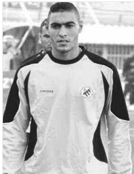
الخير الذي جمعنا بأمل الأربعة، حيث كنّا هاتزين بثلاثة أهداف نظيفة.. وأظن أن تأجيل مقابلة الداربي أمام

إن هناك العديد من النقائص التي تواجه طريقة لعب التشكيلة، حيث تلجأ إلى عدم رضاه عن أداء بعض اللاعبين وتخاذلهم فوق المستطيل الأخضر.. وأسدى المدرب الجديد للشباب نقارله عندما قال إن الأمر ليس صعبا ولكن الوقت كاف لتدارك النقائص، بشرط العمل الجدي وتكاتف جهود الجميع بمن فيهم الإدارة، الطاقم الفني بعض الأمور عند معابنته الفريق في مقابلة سريع غليزان، والتي سيبدأ في