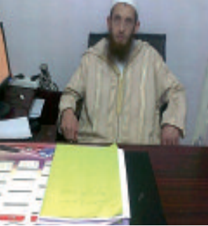
الإمام موسى زروق

وبالرجوع إلى الشريعة الإسلامية، نجد أنها أجازت اللجوء إلى هذا الباب إن كان الطريق الوحيد لدرة الحاجة، لكن على أن تقدر الضرورة بقدرها: "بمعنى أن هذا التسول ينبغي ألا يتحول إلى عادة وسلوك سهل لتأمين المال، خاصة إن كان فيه استغلال للأطفال، لأن الإنفاق من الواجبات التي تقع على عاتق الأولياء، ومن ثمة، لا بد لهم أن يجتهدوا في تلبية الحاجات وجعل التسول آخر الحلول التي يتم اعتمادها ويكون هذا الفعل بعيدا عن استعمال الأبناء بأي شكل من الأشكال، لأن من يلجأ إلى التسول بأبنائه يكون قد ارتكب جريمة في حق الطفولة.