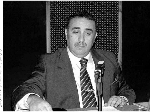
والي أدرار السيد عبد الرحمان فواتيج

كما استمع السيد فواتيج بتمتع حصيلة كل قطاع، مؤكدا أن كل المشاريع غير المنطقية بل وجب انطلاقتها قبل الفاتح من شهر سبتمبر من هذه السنة- مع غلق الاعتمادات المالية في المشاريع منتهية الأشغال، وتقييم مدى تسجيل نسبة النمو، مع الحرص على إنجاز مشاريع ذات فائدة ومبينة على دراسة لفائدة المواطن، وتطهير مدونة المشاريع من أي شكل سلبي، فيما وجه انتقادات لقطاعي المياه والطاقة، وأوصى مسؤوليه بعدم التهاون في التعامل مع مشكل تذبذب التزويد، خاصة خلال هذا الشهر الفضيل، أمام درجات الحرارة المرتفعة، قائلا: "لن تسامح بشأن قطع الماء والكهرباء عن السكان".