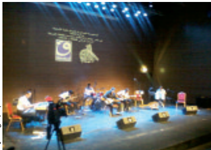
فرقة «الفردة» من بشار