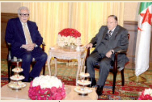
الرئيس بوتفليقة يستقبل الأخضر إبراهيمي