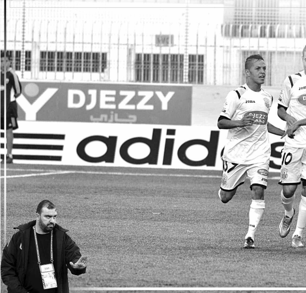
بعد تتويج وفاق سطيف وسقوط اتحاد بلعباس رسمياً

بتتويجه السابع بالبطولة الوطنية في مشواره الكروي بعد فوزه في الجولة 29 من الرابطة المحترفة الأولى لكرة القدم على شباب قسنطينة بهدفين مقابل صفر يوم السبت الماضي، يحتل وفاق سطيف المرتبة الثانية في ترتيب أكثر الفرق في البطولة الوطنية، عقب مولودية الجزائر. وبعد شبيبة القبائل صاحبة الـ14 لقباً. وفيما يتعلق بالترتيب الخامس بالبطولة والكناس معاً، يأتي وفاق داما في المرتبة الثانية من حيث عدد القاب بعد شبيبة القبائل، ولما، التي تعد 19 لقباً في خزائنها، ما قبل تقدم وفاق كل من اتحاد الجزائر ومولودية الجزائر. وبعد أصحاب الرتبة السوداء الأبيض في جيبته، رسماً معتبراً من الانقلاب الدولية بلقبين ببطولة إفريقيا ورتبة البطولة العربية للأندية وبطولة إفريقيا آسيوية، وكأس إفريقيا ممتازة، ولقبين اتحاد شمال إفريقيا لكرة القدم، وهذا بدون نسيان تأهل فريق التفرقة إلى دوري مجموعات رابطة أبطال إفريقيا 2015، والتي سيلعب أول لقاء فيها يوم 26 جوان القادم ضد اتحاد العاصمة.