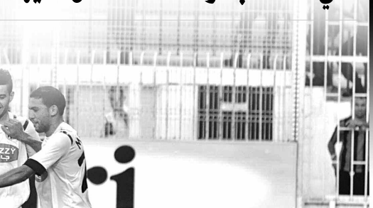
بعد تتويج وفاق سطيف وسقوط اتحاد بلعباس رسمياً

5 أندية تلعب آخر أوراقها في الجولة الـ30