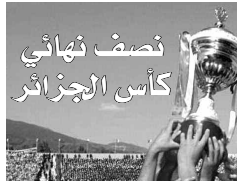
نصف نهائي كأس الجزائر