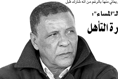
أصداء من بجاية:

تجدر الإشارة أن اتحاد الجزائر تعترف على منافسه القادم في الدور ثمن النهائي من كأس الرابطة الإفريقية، وهو أف سي كالوم الغيني بعد أن تغلب هذا الأخير على فريق زيسكو نياندي من زامبيا، وحسب الاختصاصيين في المنافسة الإفريقية، فإن الممثل الجزائري في هذه الكأس الإفريقية سيد في طريقه تشكيلة غينية صعبة المثال بسبب خبرتها الطويلة في المنافسة الإفريقية، فضلا عن أن لها مسيرة مظفرة في الكرة الغينية بفضل امتلاكها لثاني عشر لقباً في البطولة وستة ألقاب في منافسة الكأس، ولذلك، فإن اتحاد الجزائر يعرف أنه لا مجال لاستصااف المنافس الغيني بقدر ما يتعين عليه أخذ الحيلة والحذر منه، وستجري مباراة الذهاب بين الفريقين يوم 19 أفريل القادم بملعب بولوغين، بينما ستحتضن عاصمة مالي باماكو لقاء العودة بسبب داء "إيولا" المنتشر بغينيا منذ عدة أشهر.