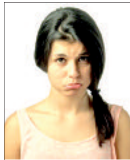
الفتاة وليس منعها.