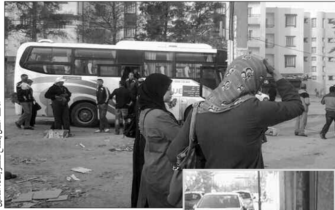
محطة النقل بفتح منتظر إعادة تأهيل

التي تربط مفتاح بالعديد من المناطق المجاورة لها، والتي هي في وضعية مهترقة جدا.