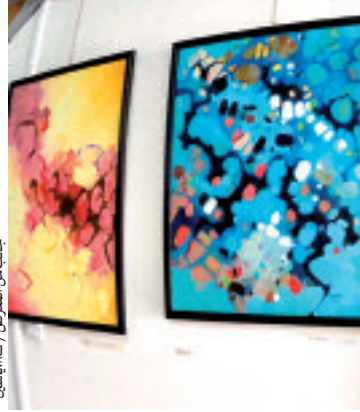
بمناسبة المعرض / تشاري أسين