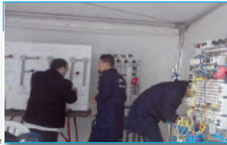
متن بصين في صالون التكوين

فكانت تشغل وقت فراغها بفتح أجهزة الراديو وإعادة تركيبها، ليتطور الأمر إلى أجهزة كهرومغناطيسية، وهو ما أثّر كثيرا